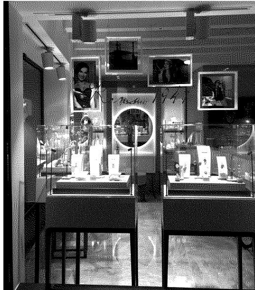
Uno dei punti vendita di Roma 1947, marchio di Better Silver ispirato alla Dolce Vita

L'azienda è la prima in Italia del settore della gioielleria in argento ad ottenere la certificazione che definisce standard mondiali sui diritti dei lavoratori e sulle condizioni del luogo di lavoro